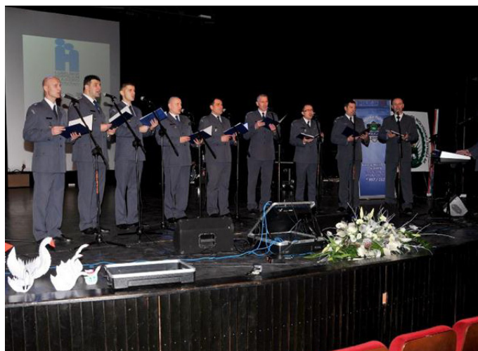
Noworoczny koncert służb mundurowych w Chelmie